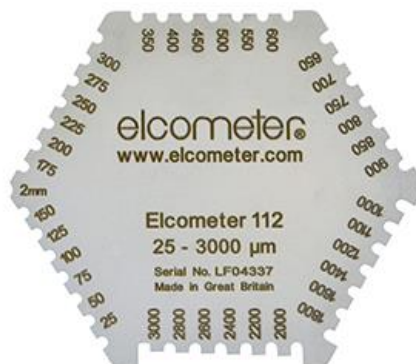
نمونه یک ضخامت سنج فیلم تر

برای انجام این تست از تیغه های مخصوص اندازه گیری فیلم تر استفاده می شود این تیغه ها در بازه های ضخامتی مختلف ساخته شده اند. هر یک از این تیغه ها دارای دندانهای مختلف می باشند که نسبت به یکدیگر دارای ارتفاع متفاوت می باشند و در بین دو پایه اصلی در امتداد یکدیگر قرار گرفته اند. شکل زیر نمونه یک ضخامت سنج فیلم تر (Wet Gauge) را نمایش می دهد.